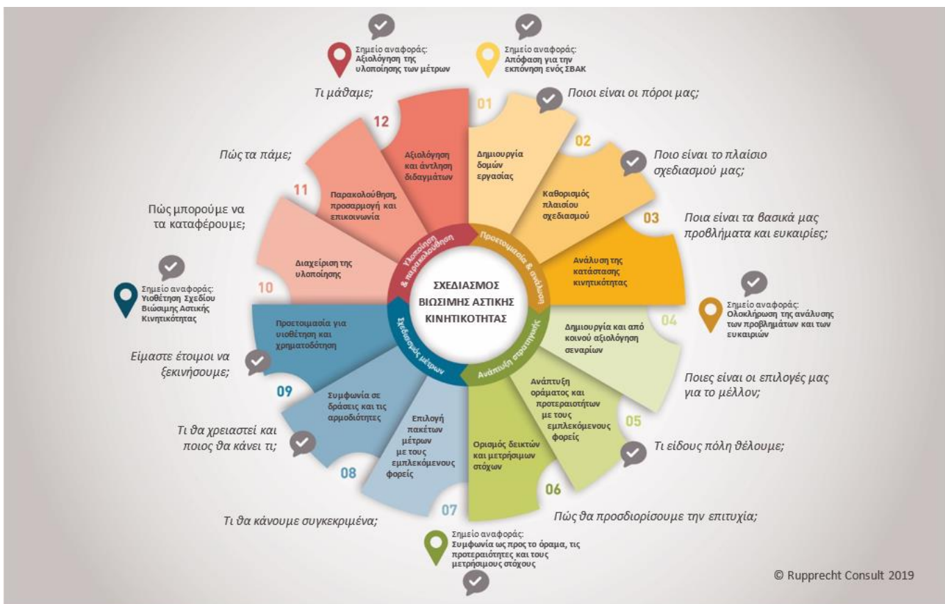
Σχήμα 1: Τα 12 βήματα του Σχεδιασμού Βιώσιμης Αστικής Κινητικότητας (2η έκδοση) – Επισκόπηση για τον υπεύθυνο λήψης αποφάσεων

Αυτή είναι, φυσικά, μια εξιδανικευμένη και απλουστευμένη αναπαράσταση μιας πολύπλοκης διαδικασίας σχεδιασμού. Σε ορισμένες περιπτώσεις, τα βήματα μπορούν να εκτελεστούν σχεδόν παράλληλα (ή ακόμη και να επανεξεταστούν), η σειρά εργασιών μπορεί να προσαρμοστεί περιστασιακά σε συγκεκριμένες ανάγκες ή μια δραστηριότητα μπορεί να παραλειφθεί εν μέρει επειδή τα αποτελέσματά της είναι διαθέσιμα από άλλη ενέργεια του σχεδιασμού. Ο κύκλος ΣΒΑΚ έχει καθιερωθεί ως ένα χρήσιμο εργαλείο καθοδήγησης που συμβάλλει στην οργάνωση και την παρακολούθηση της διαδικασίας σχεδιασμού.