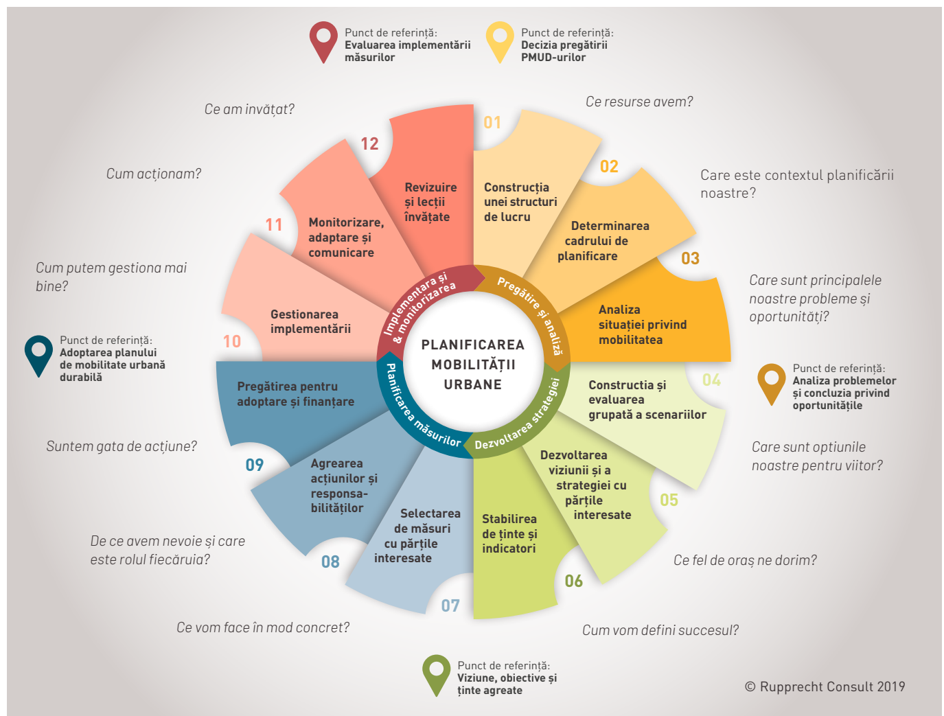
Figura 1: Cei 12 pași privind planificarea mobilității urbane durabile (a doua Ediție) – o privire de ansamblu asupra factorilor de decizie

Aceasta este, desigur, o reprezentare idealizată și simplificată a unui proces de planificare complex. În unele cazuri, etapele pot fi parcurse aproape în paralel (sau chiar repetate), ordinea sarcinilor poate fi adaptată ocazional la necesitățile specifice sau o activitate poate fi omisă în mod parțial, deoarece rezultatele acestora sunt disponibile dintr-un alt exercițiu de planificare. Cu toate acestea, ciclul PMUD s-a încetățenit ca orientare utilă care ajută la structurarea și urmărirea procesului de planificare.